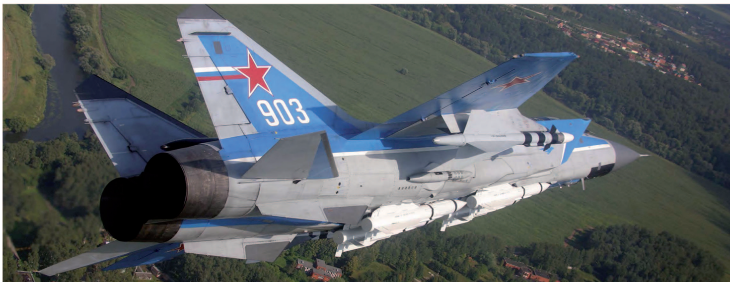
Sobrevolando Rusia en el famoso MiG-31