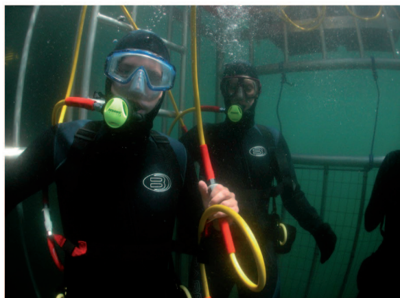
Inmersión dentro de jaulas hacia las profundidades del mar